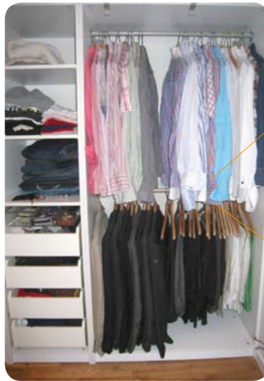
Med Solid Board